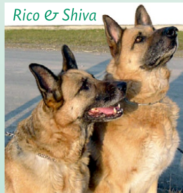
Rico & Shiva

Anfang des Jahres 2011: Es war tiefster Winter, als wir das alte Hundepaar Rico und Shiva übernahmen. Niemand wollte Rico und Shiva aufnehmen, zwei alten Schäferhunden aus dem Obdachlosen-Umfeld ein Dach über den Kopf geben. Die Tiere kommen aus der Kasseler Gegend, die zuständige Behörde suchte händeringend nach einem Platz für die Hunde. Doch wer nimmt schon alte Hunde? Dazu gleich zwei! Mein Herz hängt besonders an den alten Tieren, die