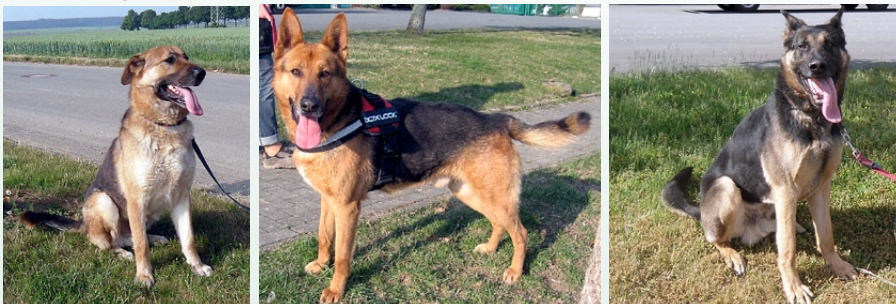
Faleno, Adelmo und Lupotto aus der Hundehölle Italien

Velia und Lello konnten wir vermitteln. Tamara lebt in einer Pflegestelle, sie war stark traumatisiert, sie zeigte viel Angst, bis zur Panik. Anfangs saß sie wie erstarrt vor uns, erwartete nur das Schlimmste. Nachdem sie nun fast ein halbes Jahr in Deutschland ist, zeigt sie Vertrauen. Wir könnten sie in eine Familie abgeben und hoffen, diese bald zu finden.