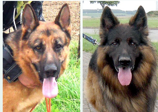
Charlie & Berry

Anfang Juli musste unsere Letti operiert werden, eine Schäferhündin aus sehr schlimmen Verhältnissen, die wir befreien konnten. Letti ließen wir ein halbes Jahr lang am Ohr behandeln, letztendlich musste eine Operation erfolgen. Sie hatte die OP bereits hinter sich, da bekam sie eine Magendrehung.