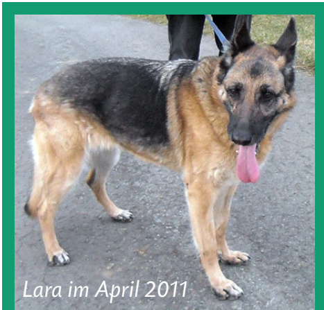
Lara im April 2011